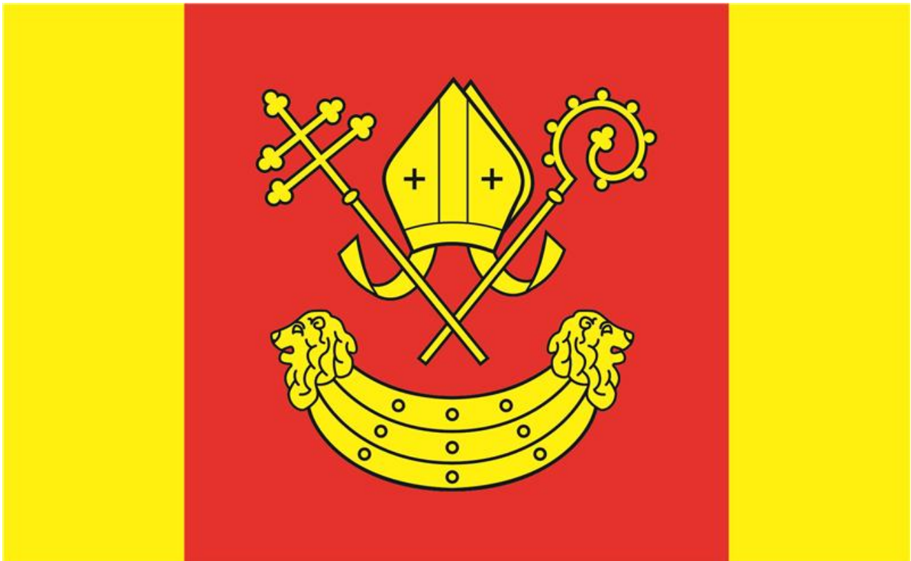
Flaga Powiatu Łaskiego

Załącznik nr 3 do Statutu Powiatu Łaskiego