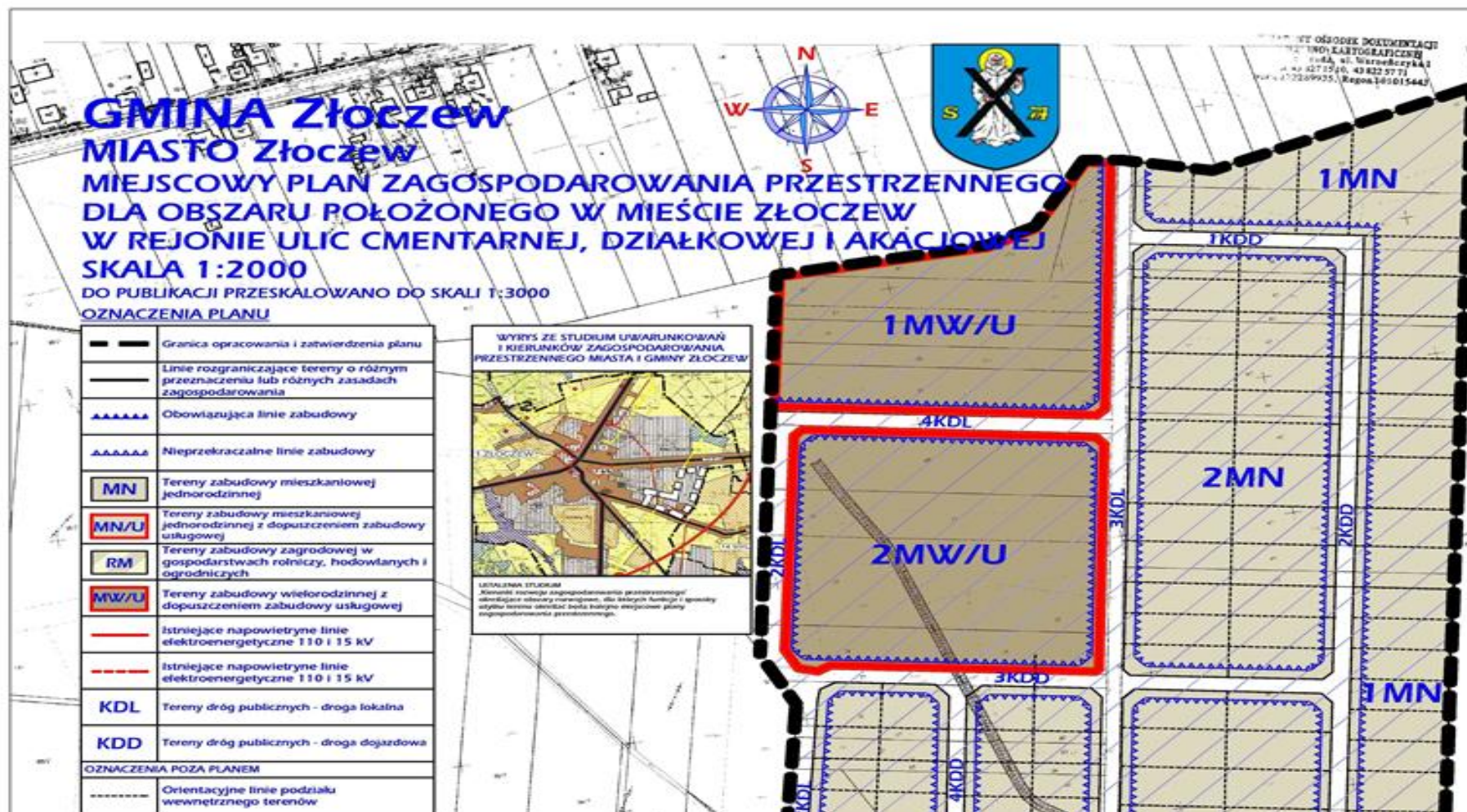
RYSUNEK MIEJSCOWEGO PLANU ZAGOSPODAROWANIA PRZESTRZENNEGO W SKALI 1:2000

Załącznik nr 1 do uchwały nr XXIII/144/12 Rady Miejskiej w Żłoczewie z dnia 19 września 2012 r.